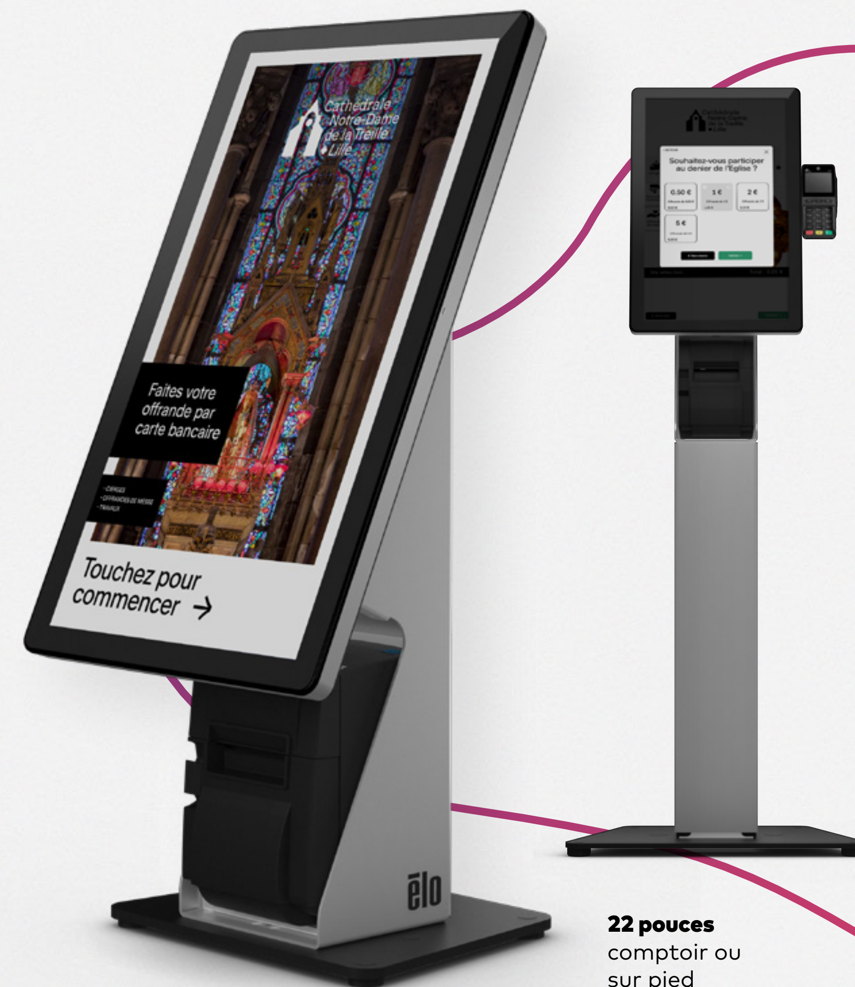
22 pouces comptoir ou sur pied