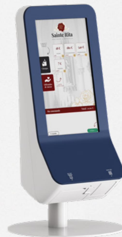
15.6 pouces comptoir disponible en plusieurs coloris